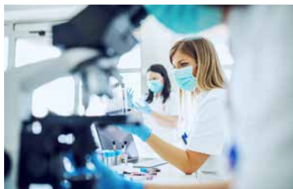
Abb. 3: Beobachten, Messen, Beschreiben und die Entwicklung von Neuem – diese Prozesse machen die Naturwissenschaften aus.