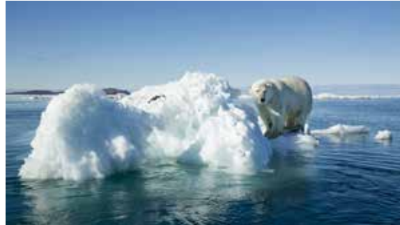
Abb. 2: Eisbär auf Eisscholle

Die natürliche Umwelt ist kein einheitliches Ganzes. Oft müssen verschiedene Gebiete der Naturwissenschaften miteinbezogen werden, um einen Sachverhalt zu beschreiben. Ein Beispiel: Ein Eisbär schwimmt auf einer Eisscholle. Die Lebensweise des Tieres fällt unter die Biologie. Hier wird erforscht, wie sich der Bär ernährt, fortpflanzt oder sich an seine eisige Umwelt anpasst. Die Beschaffenheit der Eisscholle in Abhängigkeit von der Temperatur fällt in den Bereich der Physik. Hier wird anhand von Temperaturmessungen erforscht, unter welchen Bedingungen sich der Aggregatzustand von Wasser ( H_2O ) ändert.