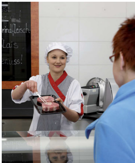
Kompetente und freundliche Beratung

Kunden einer Bedientheke oder eines Fleischerfachgeschäfts erwarten eine qualifizierte, individuelle Beratung . Sie möchten durch aufmerksames, freundliches und fachkundiges Verkaufspersonal so bedient werden, dass dieses ihnen die notwendigen Informationen über die gewünschte Ware leicht verständlich übermittelt ( Sprachkompetenz ).