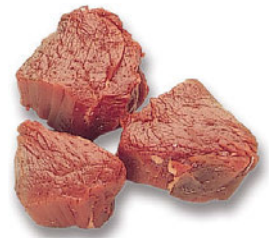
Fleisch zum Grillen und Kurzbraten

Gerade Fleischteile aus dem preiswerten Vorderteil der Schlachttiere (Schulter/Bug und Nacken/Hals) können durch geschicktes Zuschneiden aufgewertet und somit auch zu einem höheren Preis verkauft werden. So lässt sich ein Schaufelstück beispielsweise durch Herausschneiden der dicken Mittelsehne als Braten füllen, rollen und besser verkaufen. Andererseits kann man das Fleischstück mit der Mittelsehne auch durch Einlegen in Beize zu Sauerbraten nicht nur geschmacklich beeinflussen. Die Säure wirkt auf das Bindegewebe ein, lockert es auf und macht es bekömmlich und verdaulich.