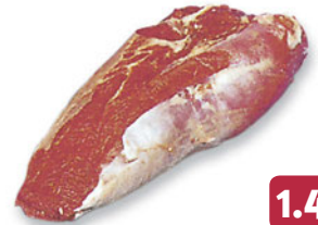
Fleisch zum Braten und Schmoren