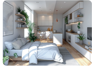
9 / monolocale