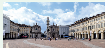
Centro storico di Torino