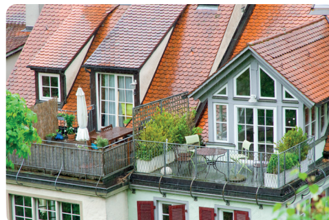
appartamento con terrazzo/balcone