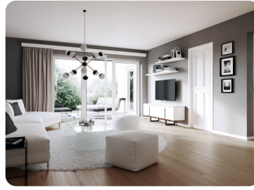
8 / soggiorno