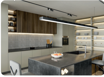
7 / cucina