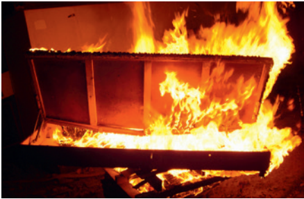
das Feuer fire