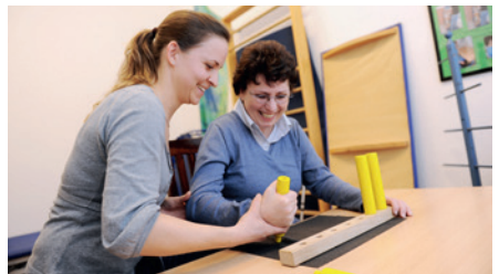
Ergotherapeut / in occupational therapist / ergotherapist