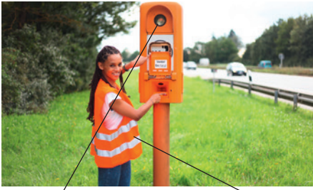
die Notrufsäule der Notruf die Warnweste emergency emergency reflective vest telephone call