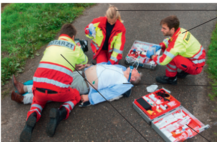
die Notfallsanitäter paramedic der Patient patient der Rettungsdienst (emergency) rescue service der Notarzt emergency doctor der Notfallkoffer medical emergency case