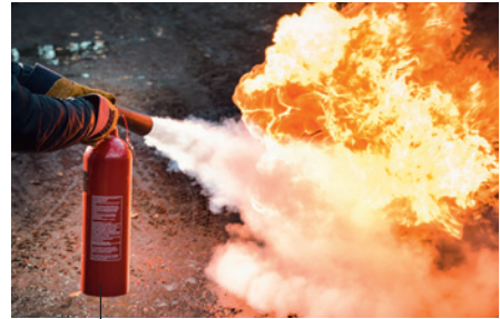
der Feuerlöscher das Feuer löschen fire extinguisher to extinguish fire