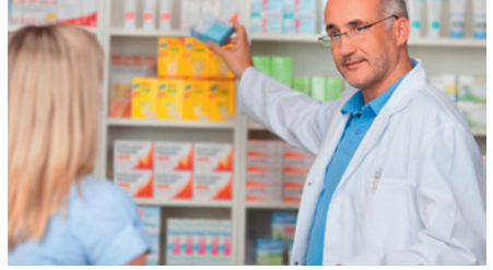
Apotheker / in pharmacist