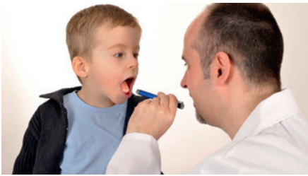
Arzt / Ärztin doctor