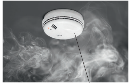
der Rauch der Rauchmelder smoke smoke alarm