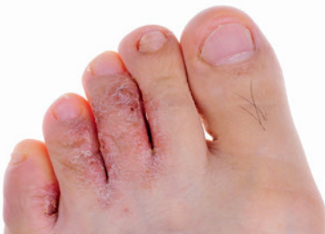
der Fußpilz athlete's foot