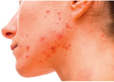
die Akne acne