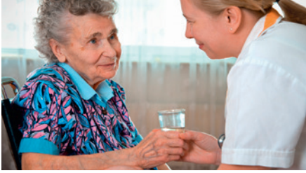
Altenpfleger / in geriatric nurse