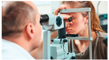
Augenoptiker / in optician