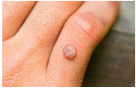
die Warze wart