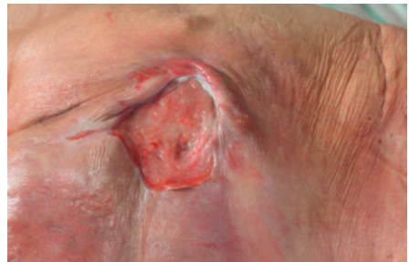
das Druckgeschwür / der Dekubitus bedsore / decubitus