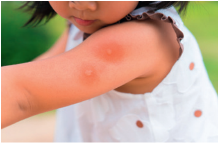
der Mückenstich mosquito bite die Schwellung swelling