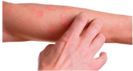
der Juckreiz itching jucken itch