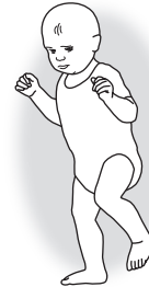
Erste freie Schritte

Mit zunehmender Sicherheit lässt das Kind die Arme sinken, bis sie schließlich seitlich hängen. (Erst viel später schwingen die Arme mit.)