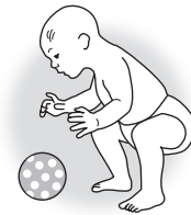
Spielt in der Hocke