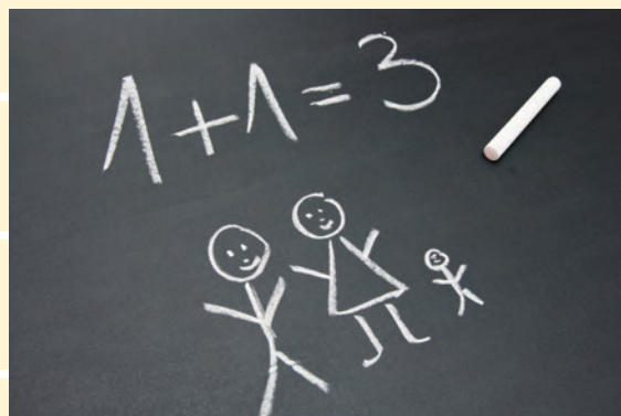
Familiengründung: Was zunächst nach einfachem Einmaleins aussieht, wird häufig zur komplizierten Berechnung.