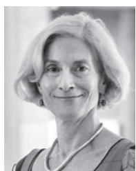
Martha C. Nussbaum (* 1947)

Argumentierenden unmöglich machen; aber dasselbe gilt auch schon von der Verweigerung des kritischen Verständnisses bzw. der Explikation und Rechtfertigung von Argumenten. Kurz: In der Argumentationsgemeinschaft ist die wechselseitige Anerkennung aller Mitglieder als gleichberechtigter Diskussionspartner vorausgesetzt.