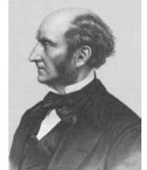
John Stuart Mill (1806–1873)

Mit dieser Abhandlung hat Mill einen der klassisch gewordenen Begründungsversuche für eine Ethik geschaffen, der ihr oberstes Kriterium in der „Nützlichkeit“ sieht.